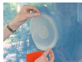
Motiv auf Glasfläche platzieren